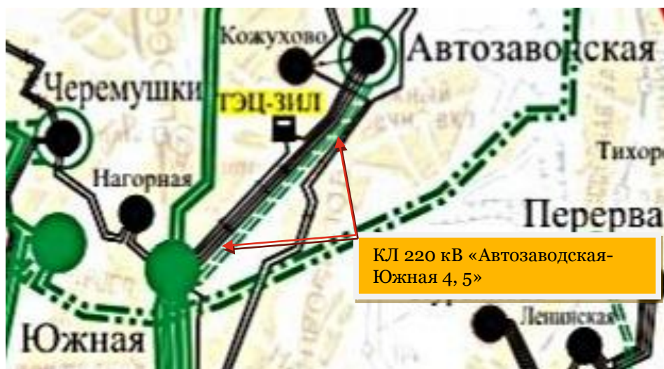
Схема 1. Схема расположения трассы КЛ 220 кВ «Автозаводская-Южная 4, 5»