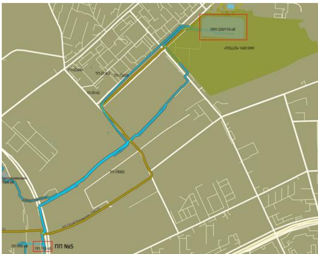
Рисунок 2. Ситуационный план КВЛ 110 кВ ТЭЦ-23 - Электрозаводская I, II цепь.