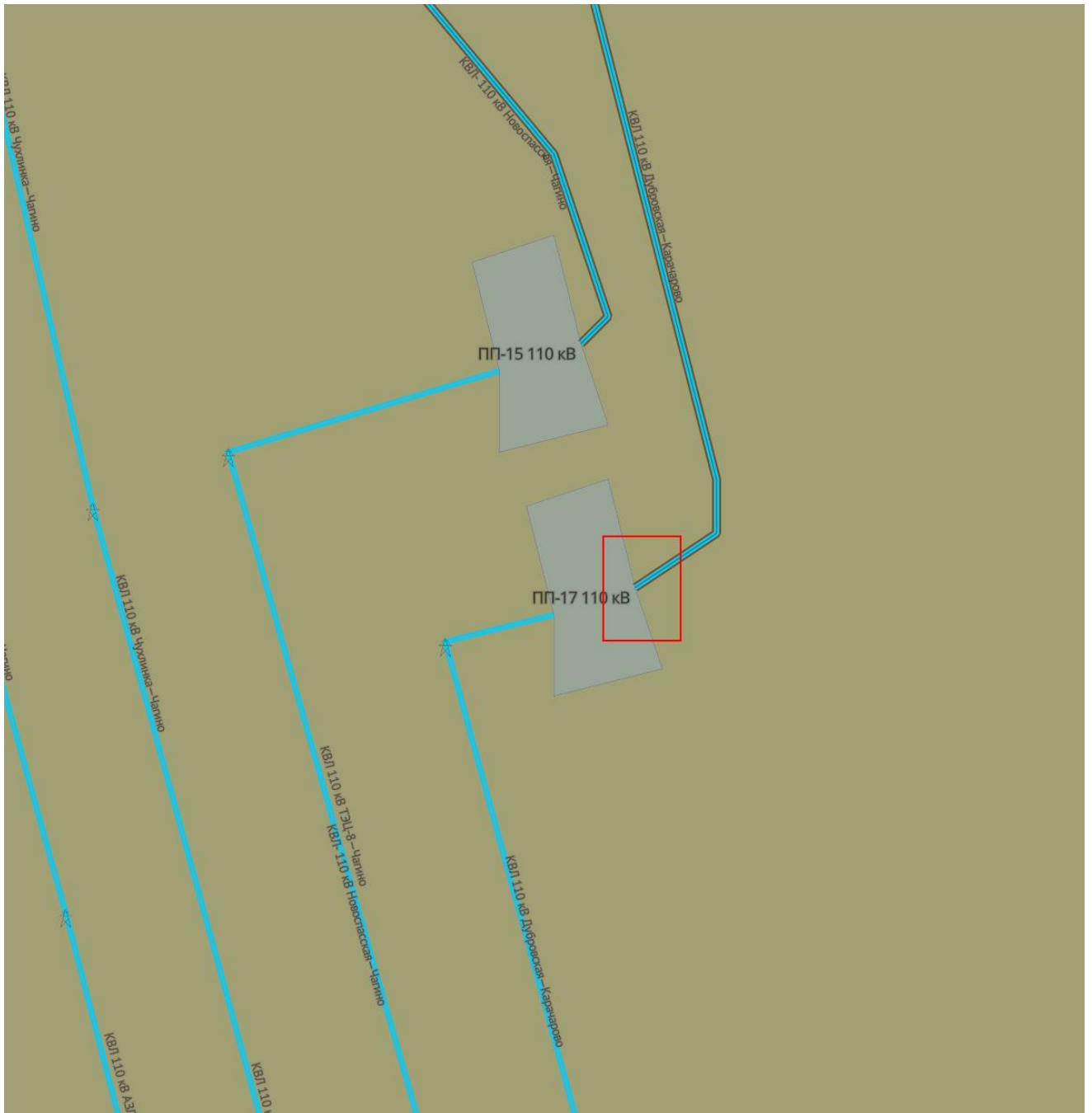
Рисунок 3 – ПС Карачарово. ПП№17 110 кВ

По заданию на проектирование по титулу КВЛ 110 кВ Дубровская - Карачарово I, II цепь, проект имеет следующие основные характеристики: