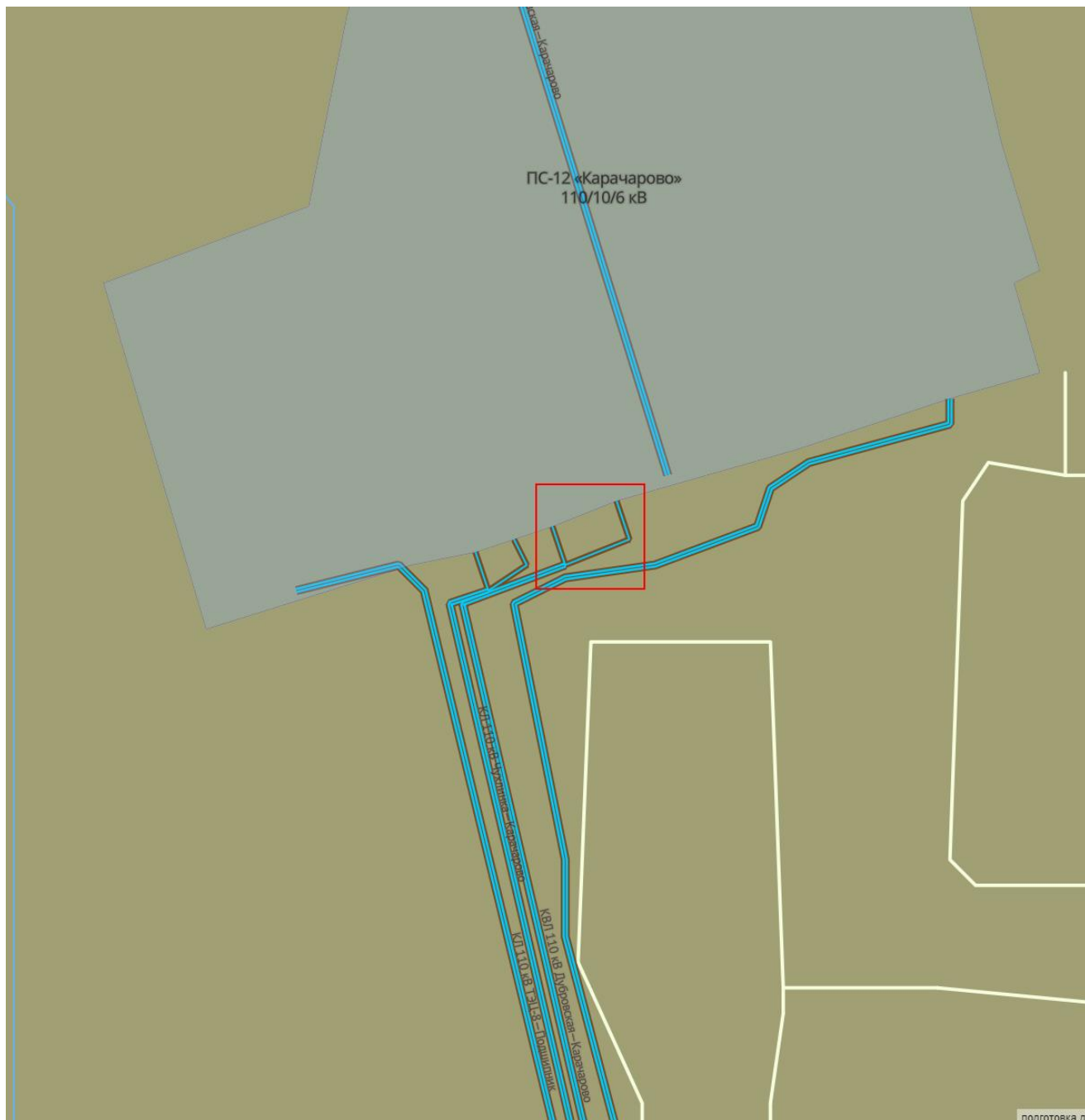
Рисунок 2 – ПС-12 «Карачарово»

Реконструируемый участок КЛ имеет 4 перехода, организованные диаметр труб 225-300 мм и завершается входом в КВЛ 110 кВ Карачаров ПП-17 110 кВ (Рисунок 3).