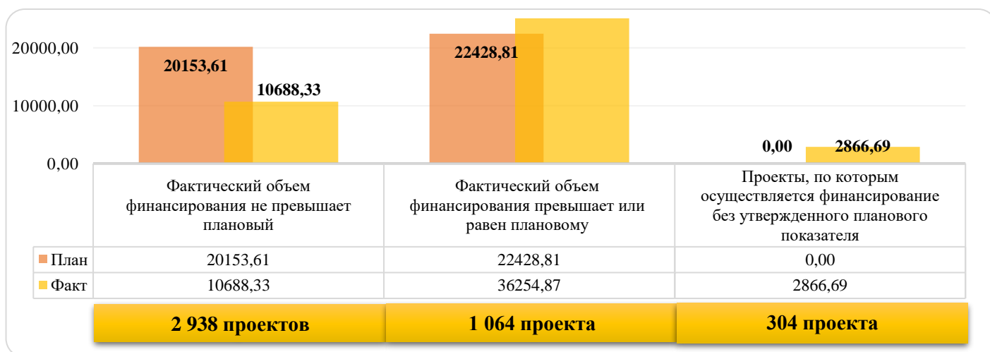
Рисунок 1 - Анализ плановых и фактических значений финансирования капитальных вложений в разрезе количества инвестиционных проектов

За 12 месяцев 2022 года перевыполнен план по финансированию капитальных вложений. К основным причинам можно отнести: выполнение работ в целях исполнения договора ТП, корректировку графика производства работ, превышение за счет капитализированных % и по факту заключения обязательств. Анализ плановых и фактических значений финансирования капитальных вложений в разрезе количества инвестиционных проектов представлен на рисунке 1.